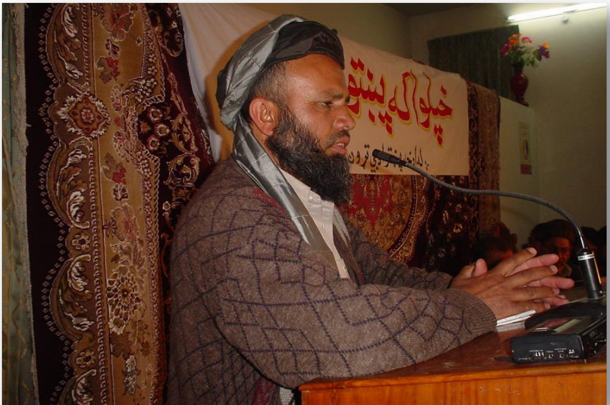
رحمت الله رحمت

بس وایم: حقداد راته وویل ، چي دناولده چاشنی به څوک نه خوري ، بیا په مسافری کي .