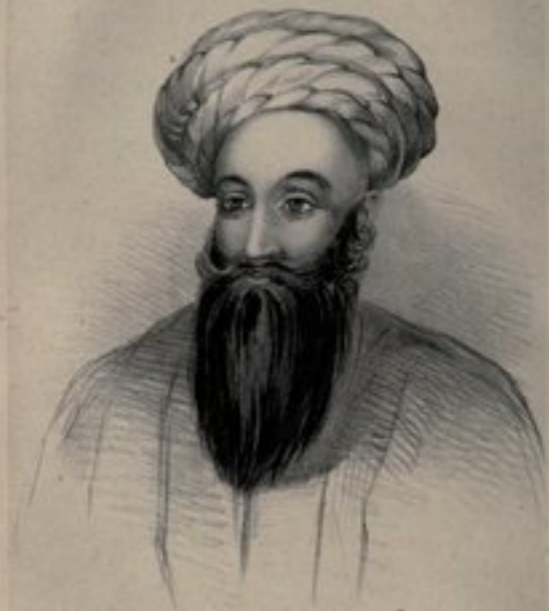
HIS LATE MAJESTY SHAH SHUJAH UL MULK.